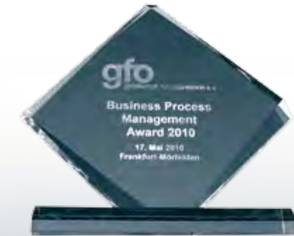
Process Solution Award 2010: Intellior-Lösung wurde als das „innovativste und mustergültigste Prozessmanagementprojekt“ ausgezeichnet.

Neben den großen BPM-Consultingfirmen ist die intellior AG ein kleinerer, dafür aber umso dynamischerer BPM-Spezialist. Sowohl unsere innovative Software als auch unsere sehr erfolgreichen Consulting-Lösungen begeistern seit vielen Jahren die Fachwelt und werden von hochkarätigen Jurys und Experten immer wieder mit renommierten Preisen ausgezeichnet.