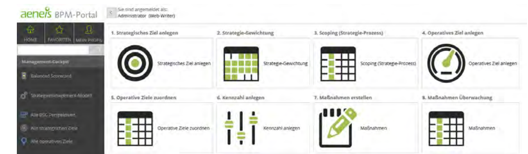
Management-Cockpit mit Einstieg in das Strategie-Management