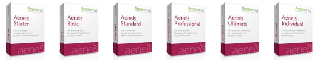
Starter Basic Standard Professional Ultimate Individual